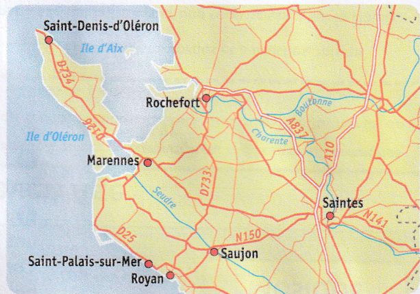
Carte routière, Charente-Maritime