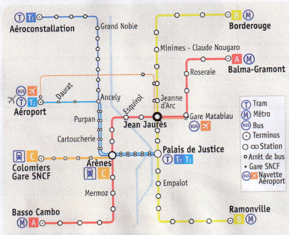
Plan de métro, Toulouse