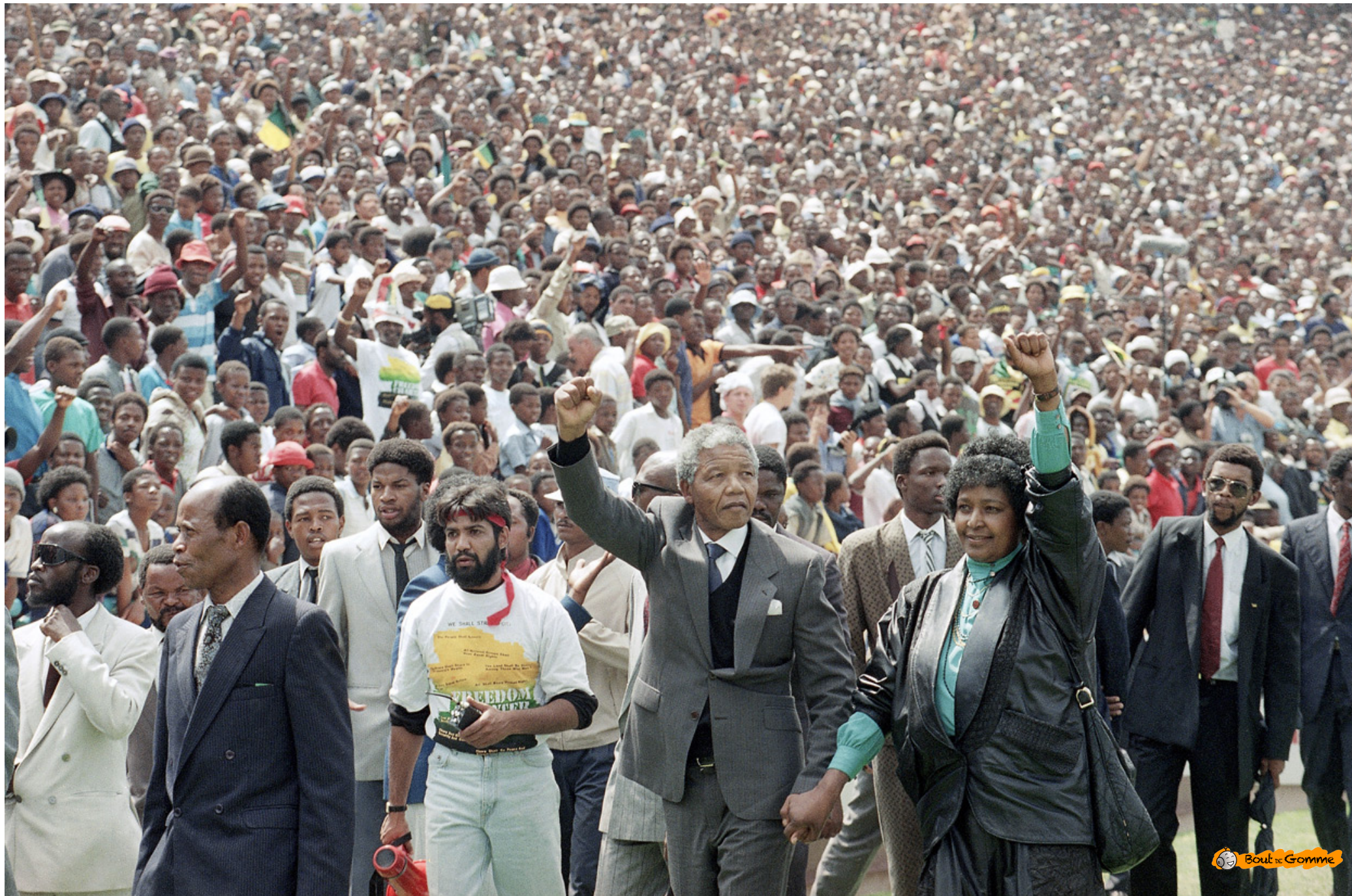
1990 Nelson Mandela est libéré après 26 ans de captivité. Avec Winnie Mandela au stade de Soweto le 13 février 1990.