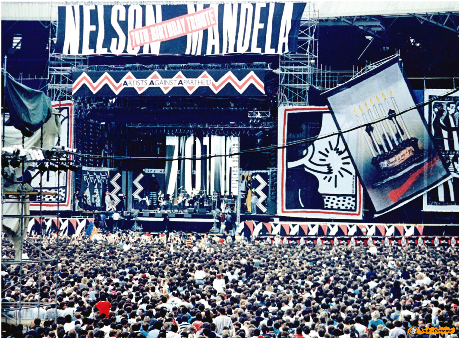
Concert en hommage à Nelson Mandela pour son 70e anniversaire en Angleterre au stade de Wembley en 1988. Plus de 83 artistes se sont produits durant les 12 h de concert.