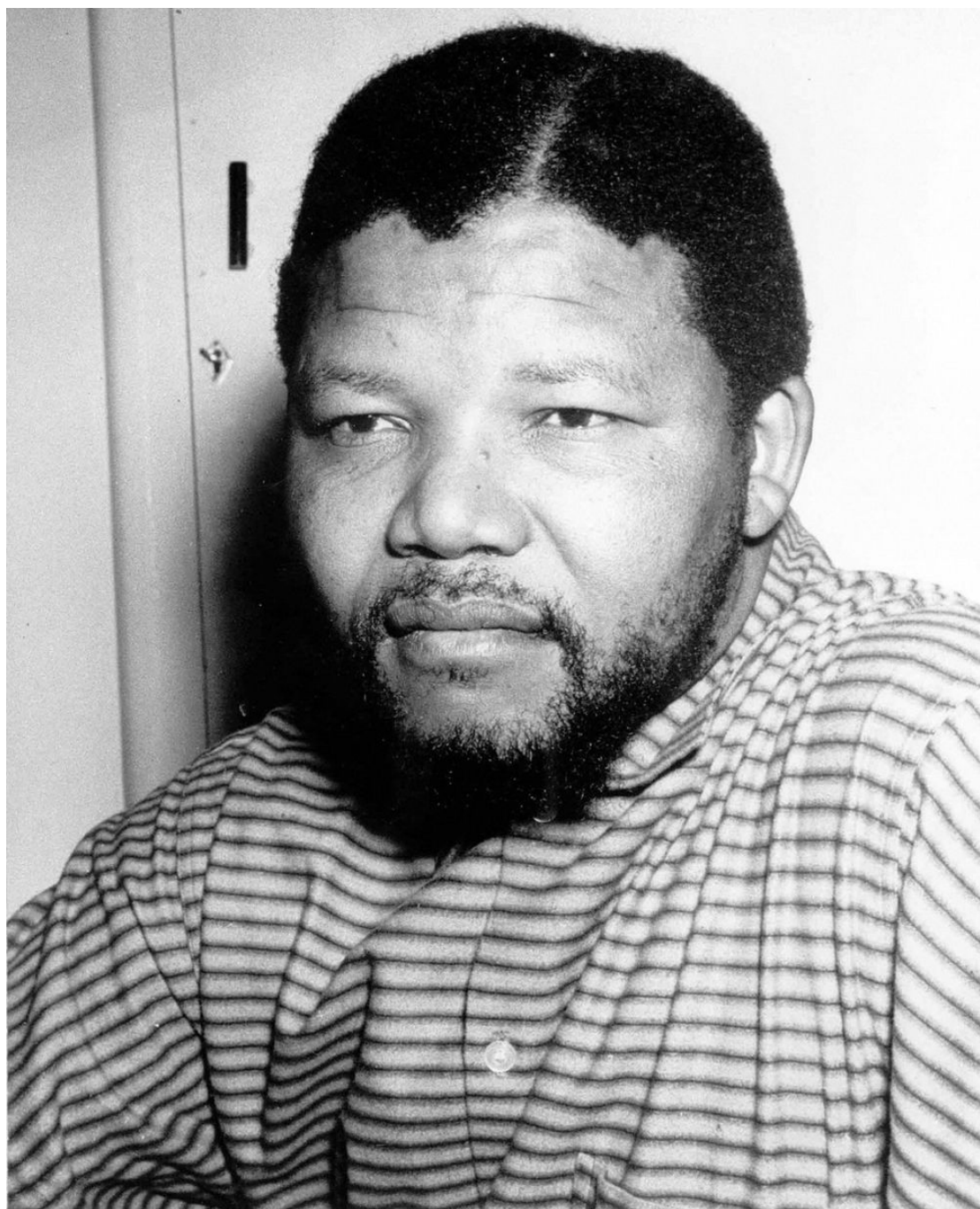
Nelson Mandela en 1961.