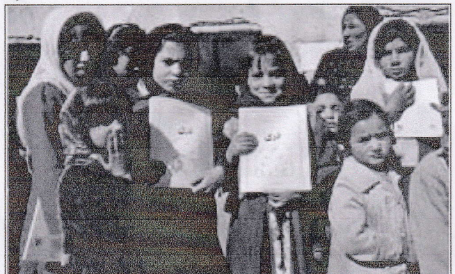
Dans les régions en proie aux conflits, comme en Afghanistan, l'UNICEF fournit des livres et des fournitures scolaires aux élèves.