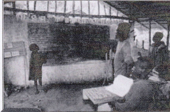
Doc 1 Une classe au Cameroun.