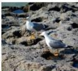
Goéland sur les côtes rocheuses bretonnes.