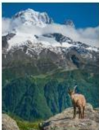
Un bouquetin dans les Alpes.

Observe ces photographies de paysages français.