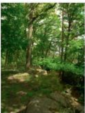
Forêt de Fontainebleau (Île-de-France).