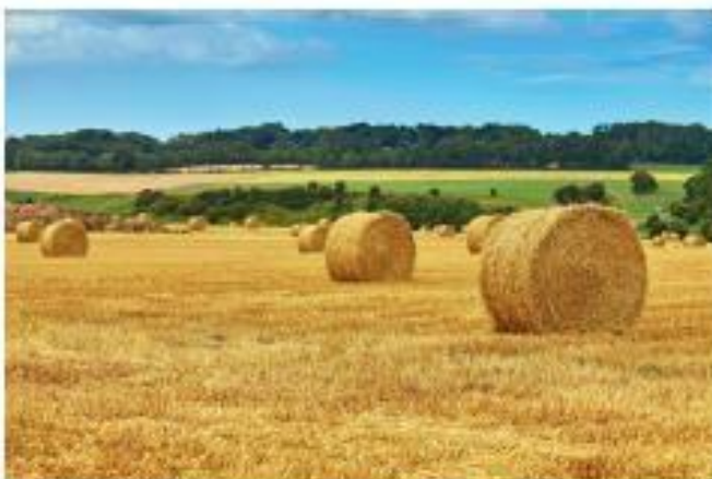
Des champs cultivés en Picardie (Hauts-de-France).