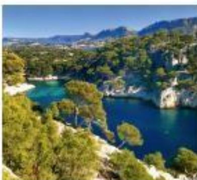
Calanques de Cassis (Bouches-du-Rhône).