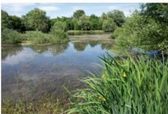
Le lac de Saint-Cassien, dans le Var (Provence).