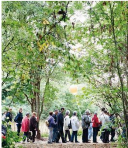
doc 1. Des espaces verts.