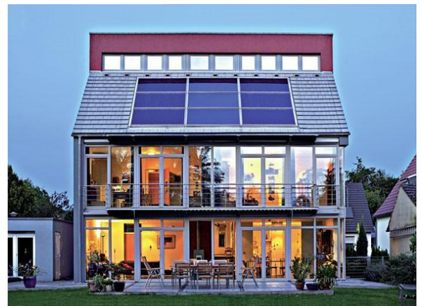
doc 3. Une maison écologique.