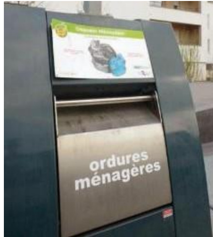
doc 2. Un conteneur d'ordures.